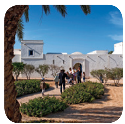
Découvrez Djerba heritage