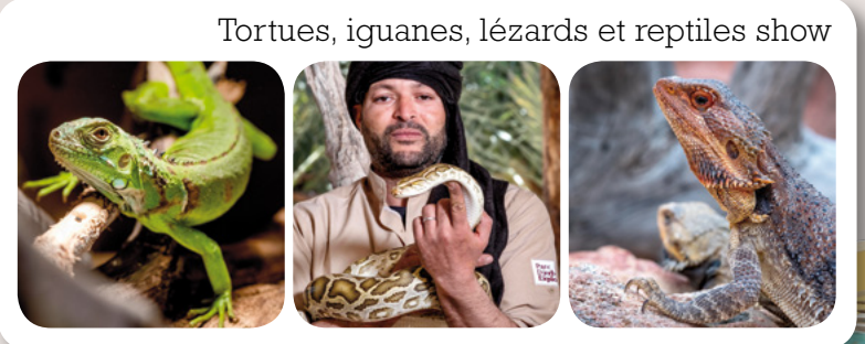
Tortues, iguanes, lézards et reptiles show