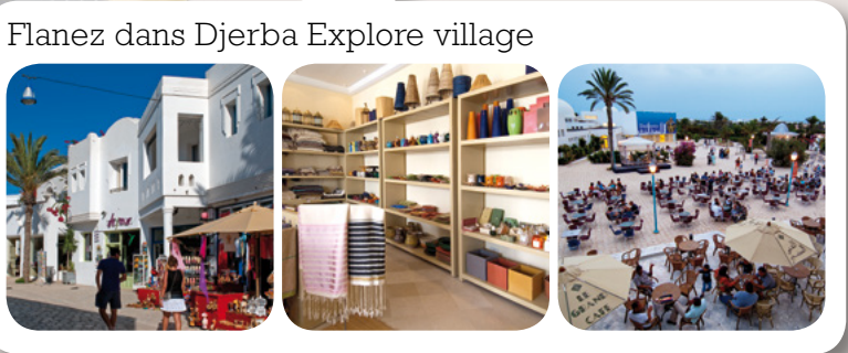
Flanez dans Djerba Explore village