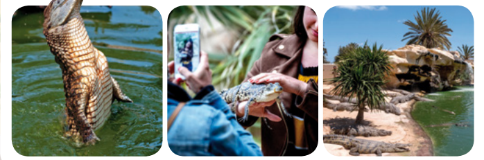
Frémissez à Crocod'îles